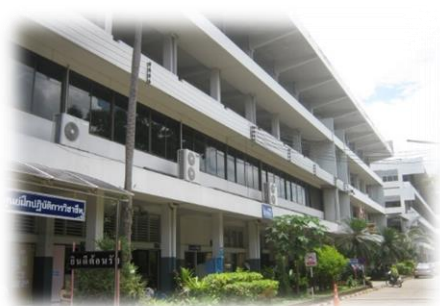
อาคาร 3 อาคารลีลาวดี

ชั้นที่ 4 ใช้เป็นห้องเรียนทฤษฎีสังคมศึกษา วิทยาศาสตร์ ภาษาไทย คณิตศาสตร์ และ ห้องพักรุ