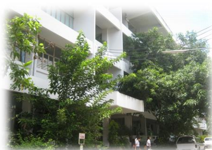
อาคาร 4 อาคารอัมพวัน